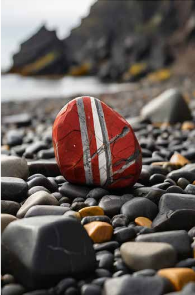
Der ominöse rote Flusskiesel, der am Meeresstrand des Fjords von Jóns Vater gefunden wurde.