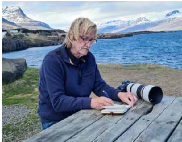
Bei stürmischem Wind und Eiskälte an einem Rastplatz kurz vorm Teigarhorn am Berufjörður. An den wichtigsten Handlungsorten machte ich mir stets Notizen.