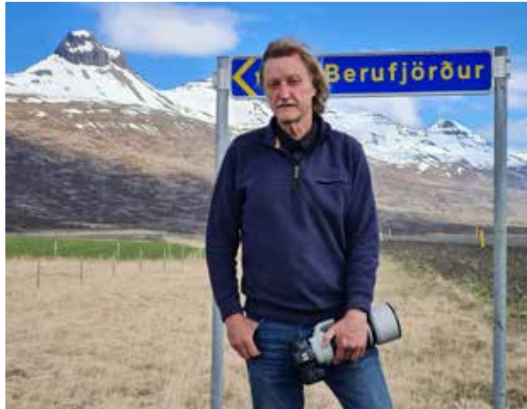
Ich konnte nicht widerstehen: Portrait vor Schild am Rande des Fjords